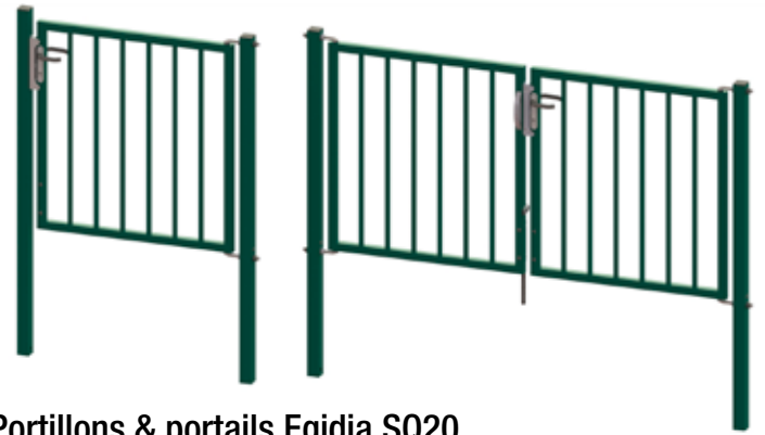
Portillons & portails Egidia SQ20

Betafence est le leader mondial du marché des solutions de clôture, de contrôle d'accès et de détection pour la protection périmétrique. Toutes les sociétés Betafence et les noms de produits sont des marques déposées de PRÆSIDIAD Group Limited. Les modifications apportées aux produits et à l'assortiment sont susceptibles d'être modifiées sans préavis.