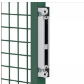
Gâche universelle en Aluminium