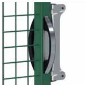
Poignée aluminium pour le vantail béquille des portails (modèles à 2 vantaux uniquement)