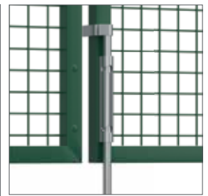
Guide et béquille fournis pour tous les portails 2 vantaux