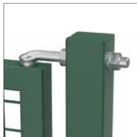
Gonds rigides, M16 (160 ou 180 mm) faciles à régler, en acier galvanisé