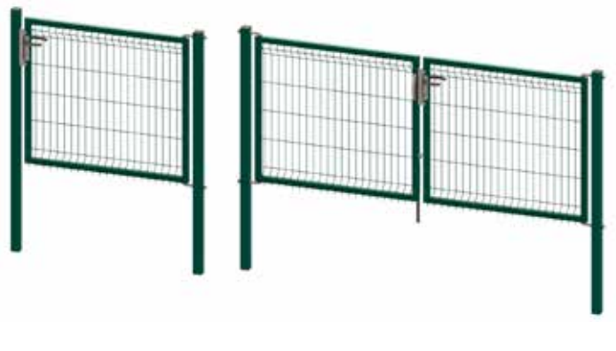
Portillons & portails Egidia 3D