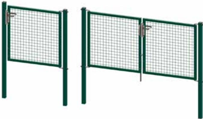
Portillons & portails Egidia M50