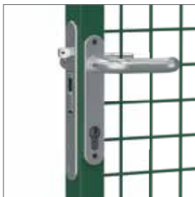
Serrure à monter dans le cadre, en inox, et poignées en aluminium