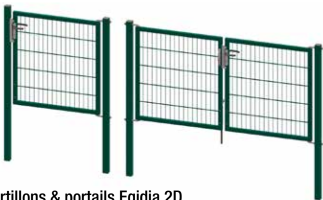
Portillons & portails Egidia 2D